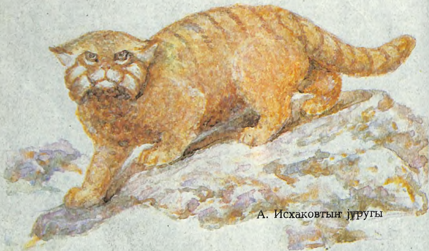
А. Исхаковтын журугу

Алтайыстын тырмакту андары мааны деп тындунан бүткен деп чөрчөктө айдылат. Бардын, шүлүзининг ле оноң өскө казыр андардын энези болгон соңында, ол сүрекей жаан аң болгон болор бо?