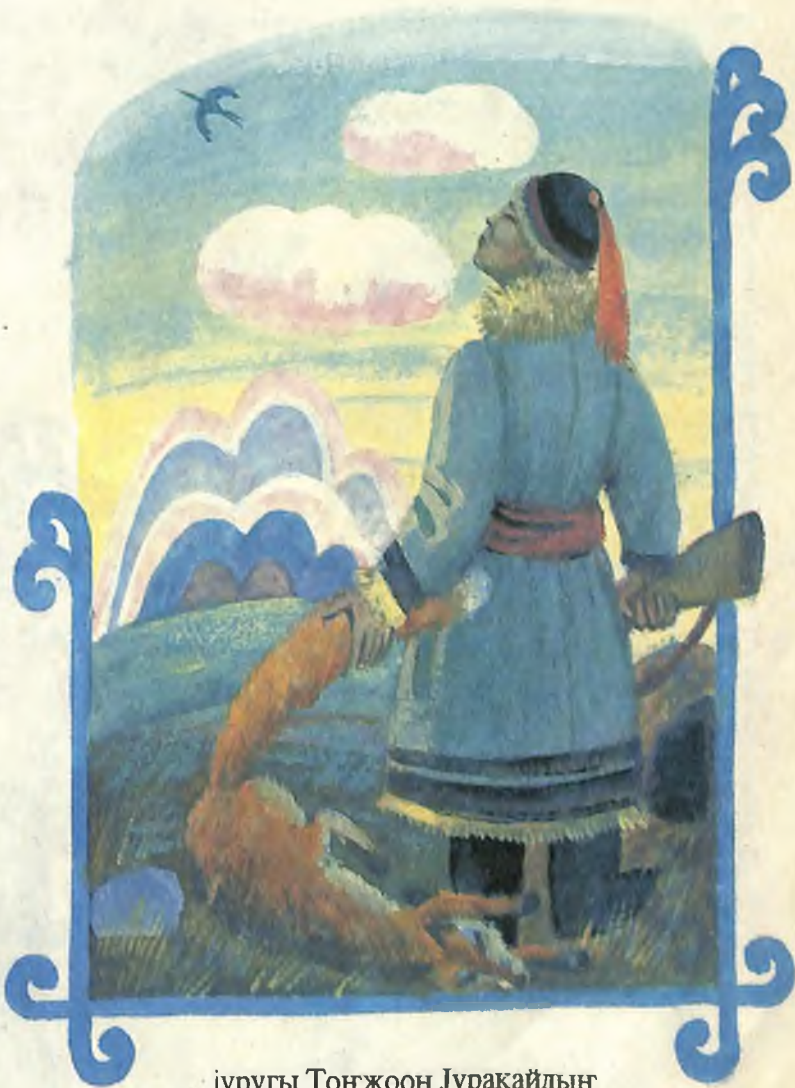
... журугу Тонжоон Журакайдын

Жангыс сагышту турна ады-чуузы чыккан анчыны да мекелеп ийди.