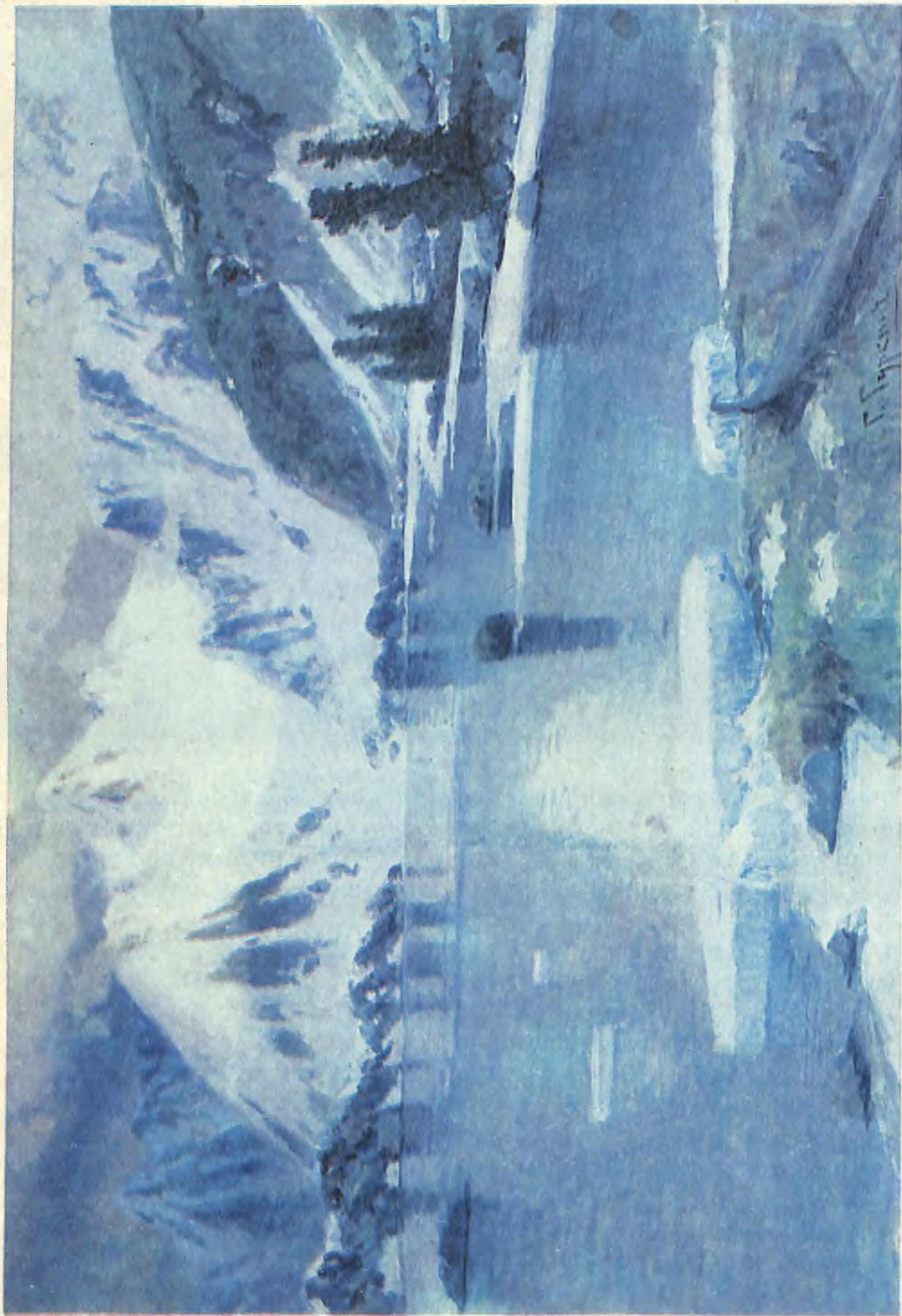
«Јагы јер» — «Озеро горных духов» 1910 ј.