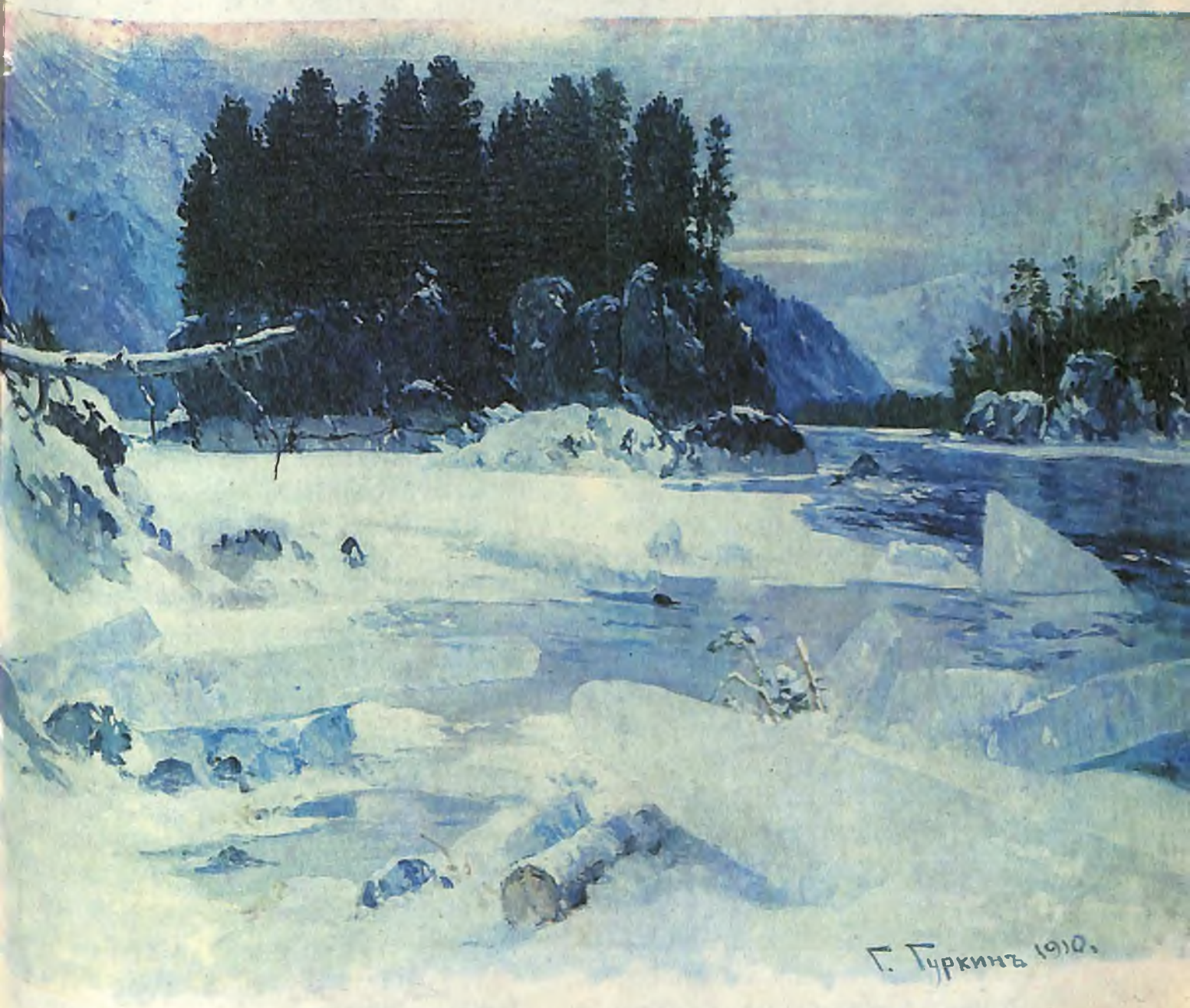
«Кадынның сүдери» — «Корона Катунь» 1910 ј.

1910 жылда Томскта, Красноярскта, Иркутскта, 1911 жылда Барнаулда, 1915