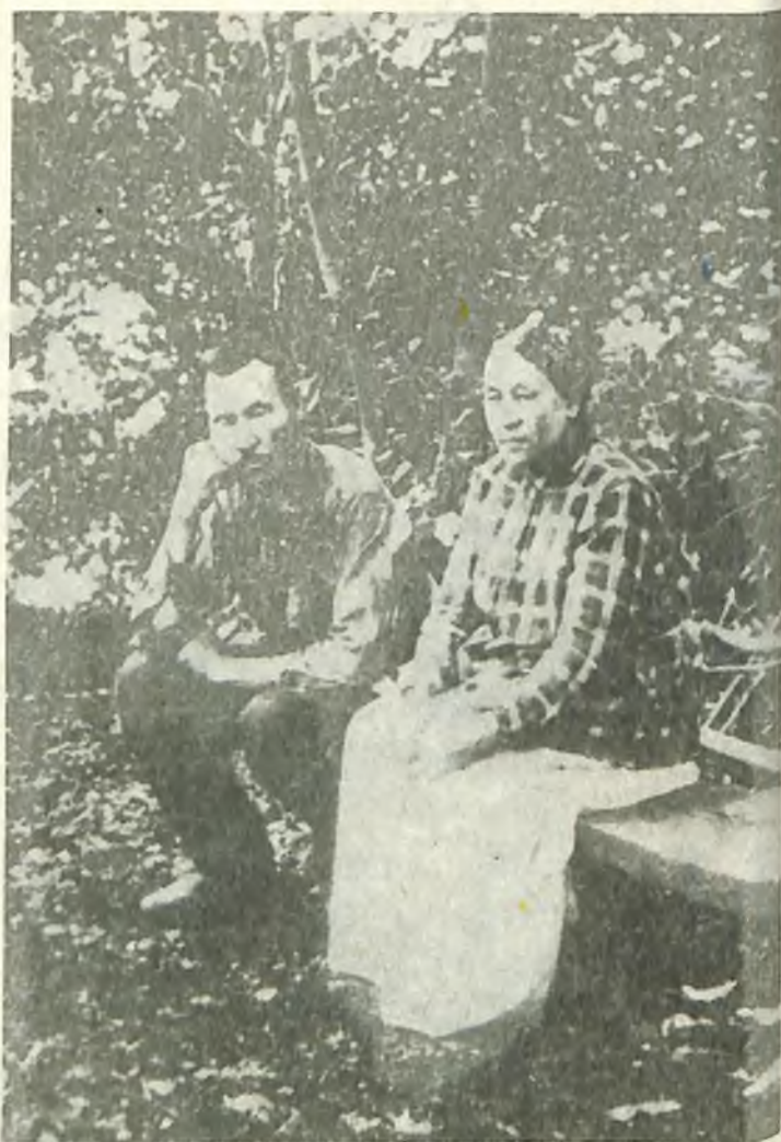
Г. Гуркин үйиле кожо

Онос ло Ызнези журттар Кадын кечире тургулайт. Мен адамла кожо Гур-