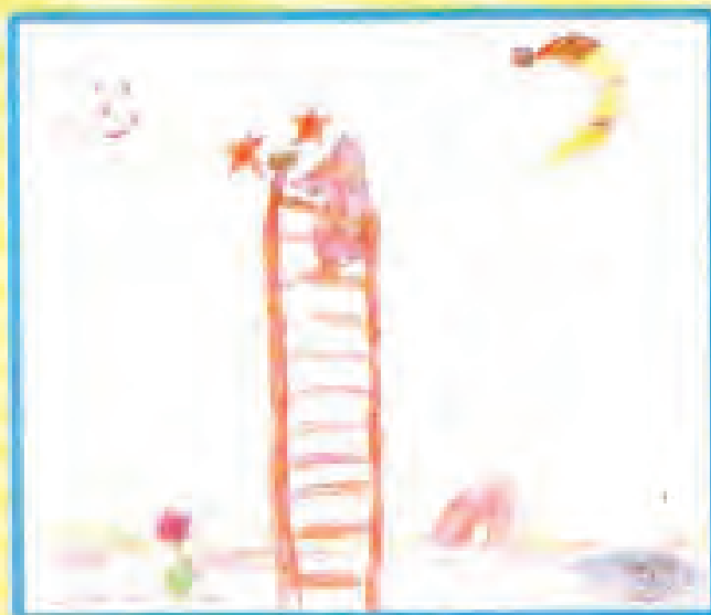
Рисунок Курбатовой Лены