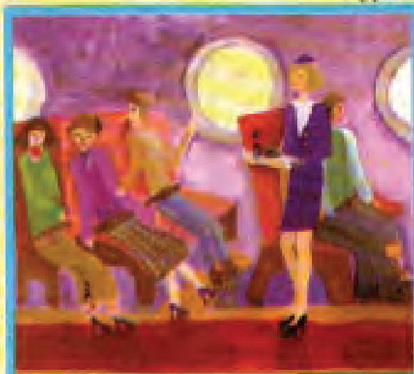
Рисунком Дюжаревой Ивны, 12 лет

Я кормушку из дощечки смастерю, Сыплю крошки, победой говорю. А синица непохожа на синицу — Не дерётся, угощает разных птиц.